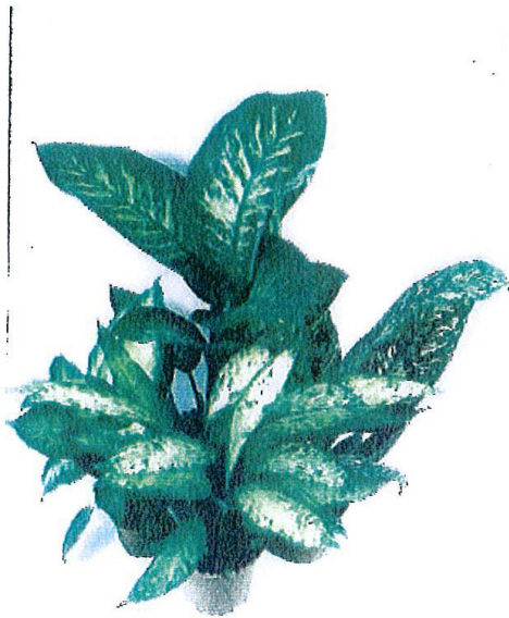
Prickblad - ( Dieffenbachia seguine ssp.)

Ring 112 vid inträffade förgiftningstillbud och begär giftinformation - dygnet runt Ring 08 - 33 12 31 vid övriga frågor om akuta förgiftningar - dagtid