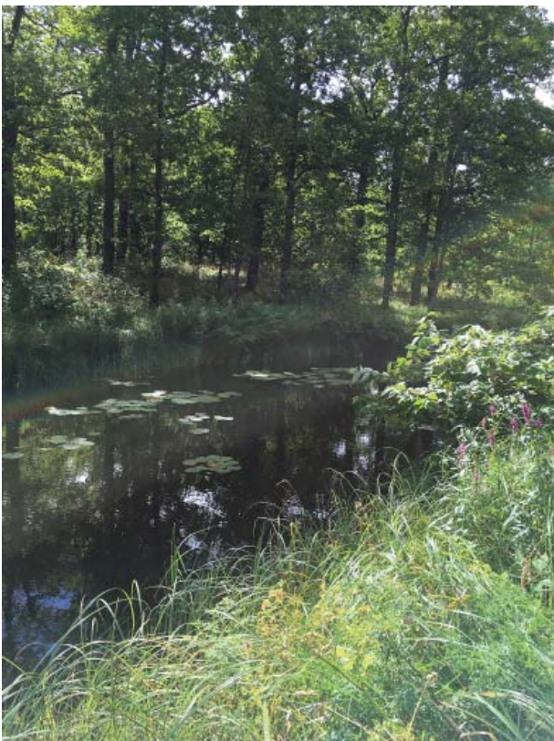
Västra kanalkanten slåttas 2 gånger/år

Näckrosor skall också begränsas genom att 2/3 tas bort vart annat eller vart tredje år . Näckros måste