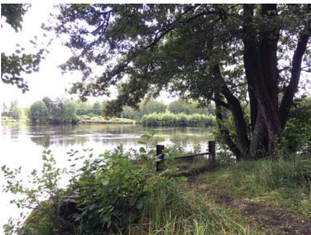
Platsen för den gamla stenbryggan är vacker. Här behövs en soffa.

Ytor markerade som genomsiktig vegetation bör röjas från sly minst