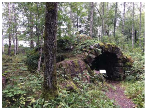
Grottan från nordväst. Sly får inte rota sig på konstruktionen.

Mellan hasselbuskar/hasselbuketter ska avståndet vara minst 5 meter för att de ska kunna breda ut sig