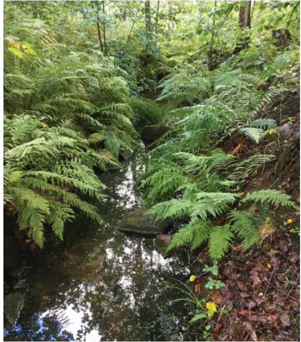
Det grävda diket skall hållas öppet. Ses över varje år.

vartannat år. Det ska vara så pass glest och luftigt att det går att se igenom vegetationen fram till nästa skötselområde. Träden ska stå som solitärer med minst 10 m till nästa träd. Lövträd i den södra delen kan också stå tätt tillsammans, clumps. Då skall avstånd till nästa träd vara minst 25 meter. Buskar som hassel, rönn, skogsolvon etc får förekomma som solitärer.