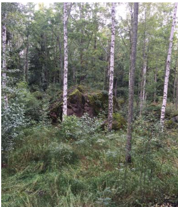
Grottan från strandpromenaden.

ordentligt. Hasselbuskarna föryngras genom att de grövsta grenarna i buketten tas bort(ca 1/5 av grenarna) var 5:e år .