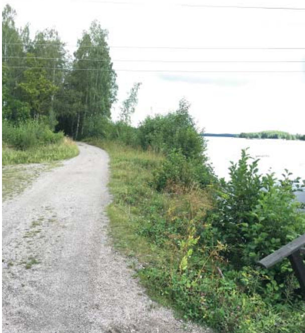
Den norra promenaden längs älven. Här kan enstaka träd ur slyn få växa upp, minst 10 meters mellanrum mellan träd. Beståndet längre fram är för tätt. Mindre grupper av träd kan stå längs stranden men då behövs minst 15 meters lucka till nästa träd.

Den norra promenaden längs älvstranden ska upplevas som ljus