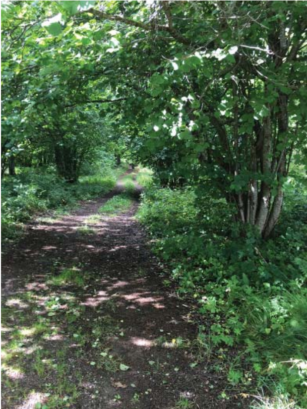
De vackra hasselbuketterna kan förnygras vart femte år genom att de allra grövsta grenarna skärs bort, ca 1/5 av buskens grenar.

I norra delen finns främst björk, lärk, ek, gran, rönn och samt utmed vattnet al. Notera att i tidiga bilder finns en gran på var sida om grottan. 2016 finns här ek men ingen gran. Det kan därför vara lämpligt att låta en eller två granplantor växa sig stora nära grottan.