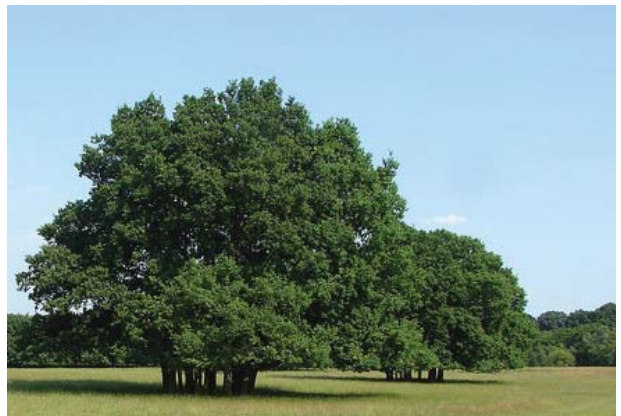
Det ska också finnas öppna ytor fria från träd där träden istället får stå i grupp som så kallade clumps = små dungar. Det kan med fördel gallras för att uppnå detta i områden markerade med Gles vegetation på kartan.