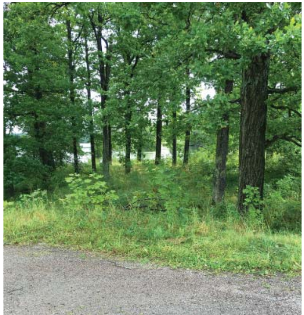
Vegetationen ska vara genomsiktig som här i mitten av bilden. Det ska också finnas större öppna ytor se nedan.

I södra delen består dessa ytor främst av ek, björk, hassel och al men även alm, ask, lind och lönn förekommer.