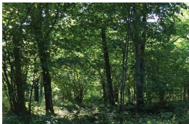
Det ska vara minst 15m sikt in i gles vegetation.

Röjning av sly utförs var 3:e år . Det ska vara god sikt minst 15 meter in i beståndet.