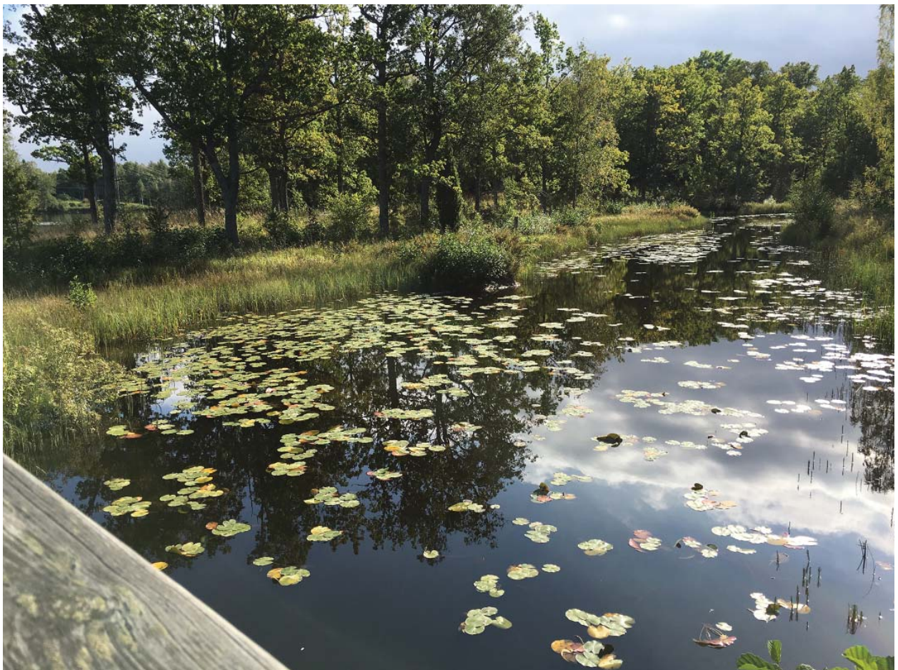
En vacker vy från Bågbron över kanalen. Näckrosor och vass måste hållas undan vart annat till vart tredje år.

Kanalens in- och utlopp röjs från eventuella hinder/skräp varje vår och höst . Eventuellt skräp under broarna tas bort samtidigt.