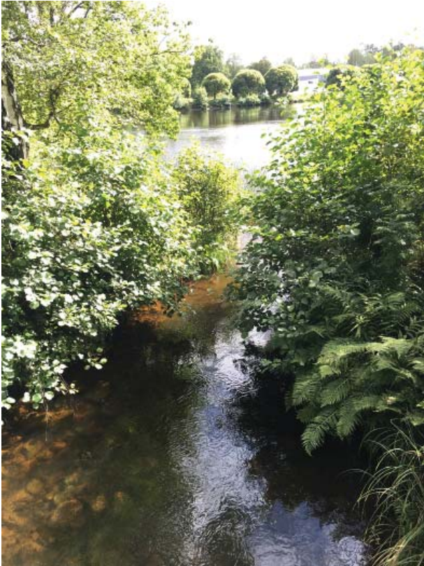
Kanalmyrningar rensas vår och höst.

Näckrosor skall också begränsas genom att 2/3 tas bort vart annat eller vart tredje år . Näckros måste