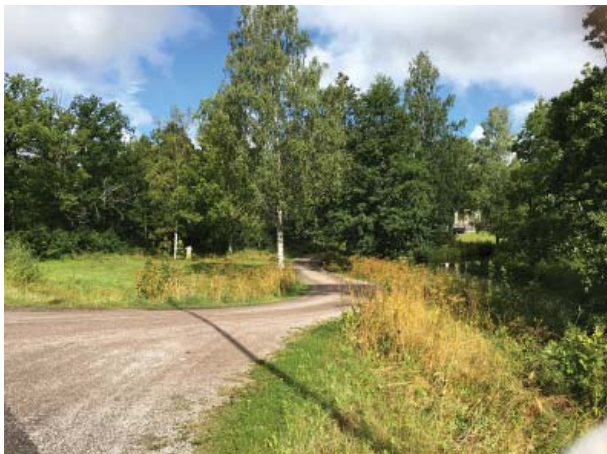
Ängen, vägkanter, västra kanalkanten slåttas 2 ggr/år

Ängsytan till vänster om entrévägen mot Templet samt ytor längs delar av gångvägarna, intill den gamla badplatsen och utmed kanalen skall klippas med slåtteraggregat 2ggr/år . Slåttern ska utföras en gång i