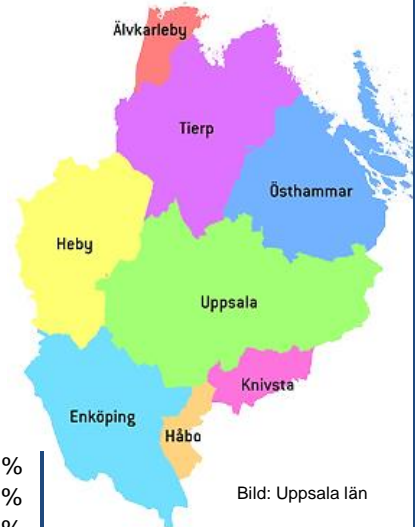
Bild: Uppsala län

Tierps kommuns yta: 1 550 km 2 14 invånare per km 2