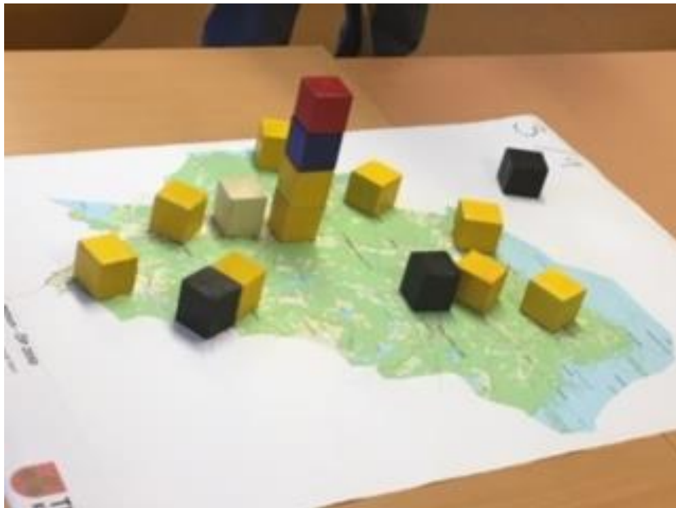
Resultat av klossövning grupp 3 - Centralskolan

Kommentar från gruppen: Djur och natur ska bevaras. Bostäder i perifera lägen leder till ökad trafik.