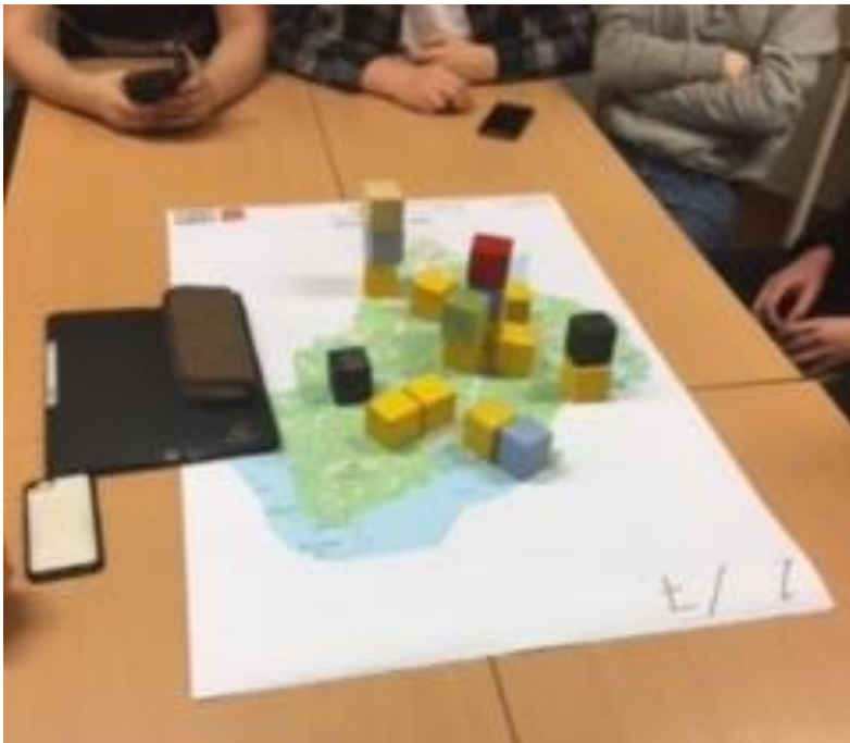
Resultat av klossövning grupp 1 - Centralskolan

Kommentar från gruppen: Gruppen är inte helt överens, utan frågan diskuteras. Tillslut beslutar man att grönområdet ska bevaras, om det är fint eller roligt och inte bara tråkig skog.