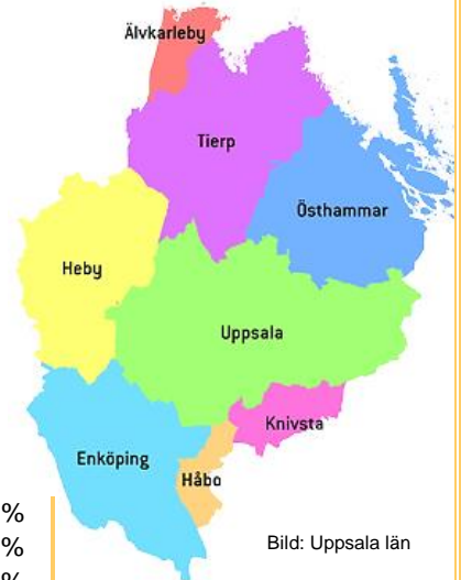
Bild: Uppsala län

Tierps kommuns yta: 1 550 km 2 13,7 invånare per km 2