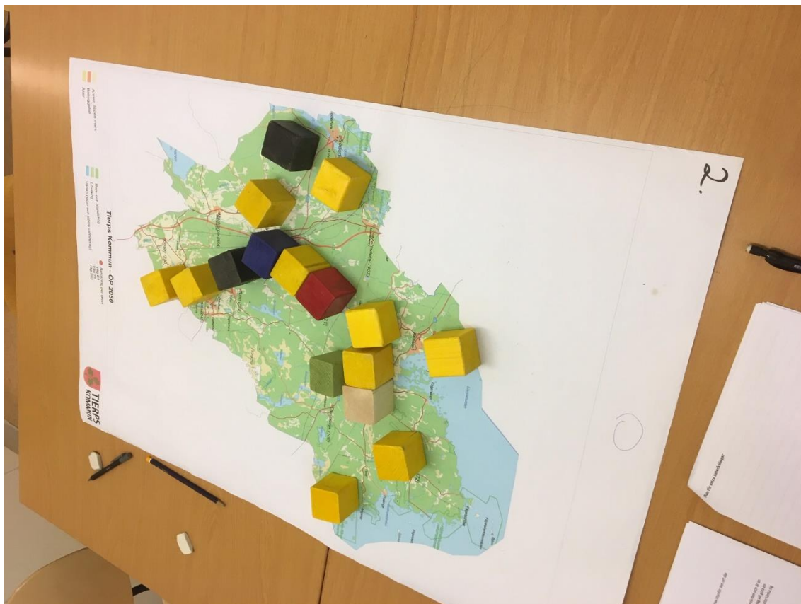
Resultat av klossövning grupp 2 - Olandersskolan

Kommentar från gruppen: Det är så lugnt och fint i Skärplinge nu, det ska vi inte förstöra.