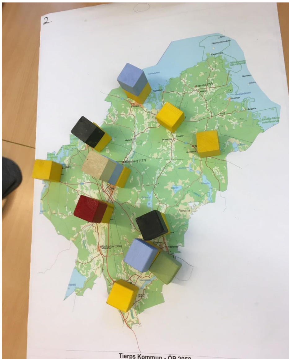
Resultat av klossövning grupp 2 – Örbyhus skola

Kommentar från gruppen: Det är viktigt med hållbarhet. Natur och rekreation är viktigt. Bostäder får byggas på annan plats.