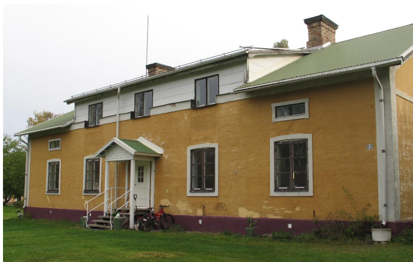
Skolvägen 12, Pesarby 2:107, västfasad.