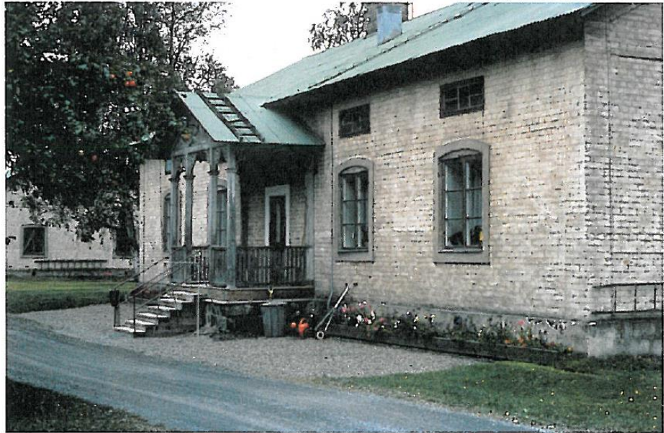
Stängslan 1973. foto: Ola Ehn (DLA685)

De öppna farstukvistarna har vitmålade lövsågerier tillverkade på snickerifabriken. Vissa av husen har också mindre och enklare farstukvistar, i dagsläget har inte alla byggnaderna farstukvist med snickarglädje.