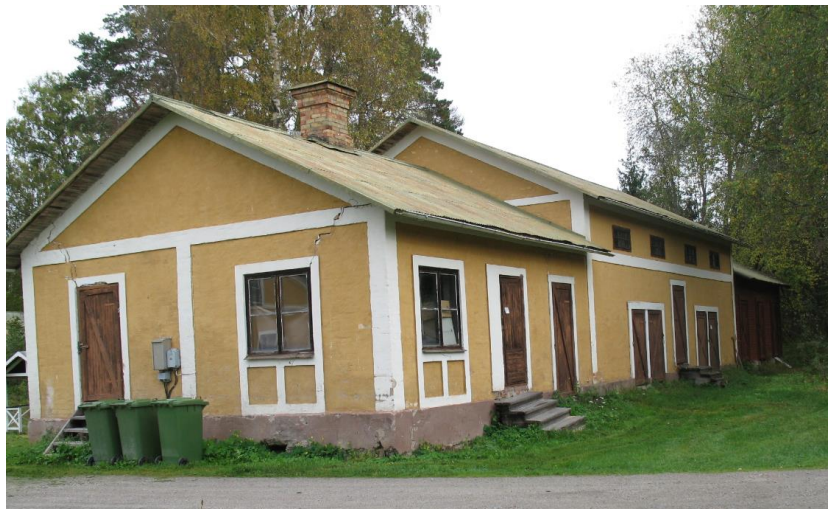
Uthus, Pesarby 2:129

Uthusen består av tre delar, en högre och en lägre del som är putsade, samt en del i trä som är rödmålad.