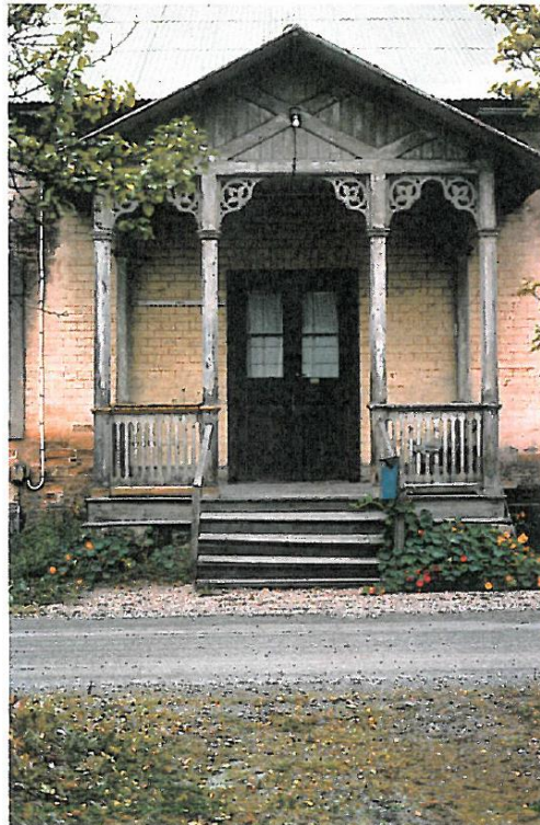
Stängslan 1973. (DLA2153)