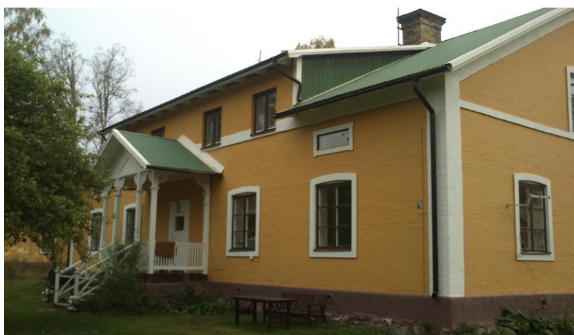
Skolvägen 4, Pesarby 2:111, västfasad.