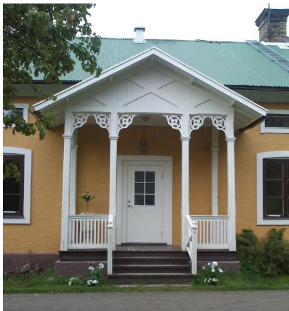
Skolvägen 4, Pesarby 2:111, östfasad.